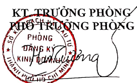
Huỳnh Nhật Trường